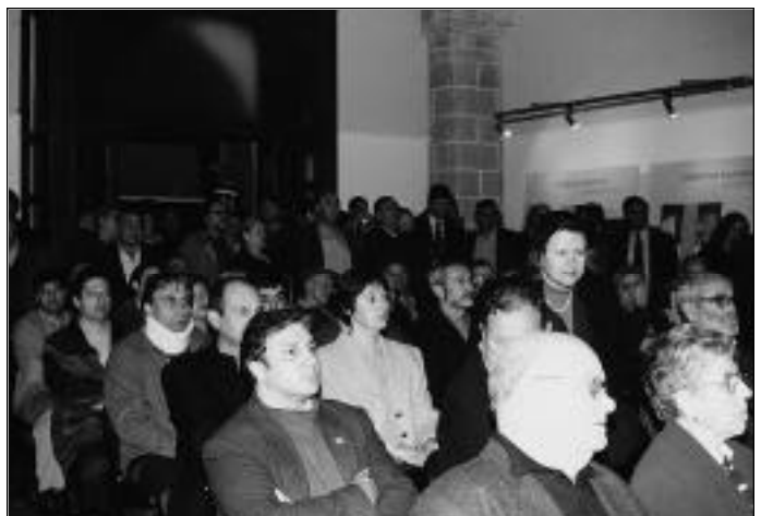
El molí de la Cooperativa Agrícola ja ben restaurant i a ple rendiment. A baix imatge de la gran quantitat de públic que va assistir a la inauguració del projecte experimental i a la firma del conveni.