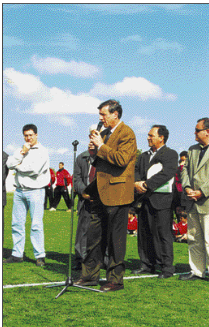
— Imatge de l'acte d'inauguració de les noves instal·lacions esportives de Campos.

L'acte de presentació va estar presidit per les primeres autoritats campaneres encapçalades pel batlle i va comptar amb una gran participació, tant pel que fa a esportistes com de públic. En principi la inauguració s'havia de realitzar el divendres Sant, però a causa de la pluja es va haver de celebrar el passat dissabte dia 6.