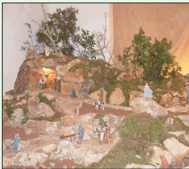
- Imatge del Betlem que han muntat les associacions de pares en el Convent.

Equip de govern de l'Ajuntament de Campos