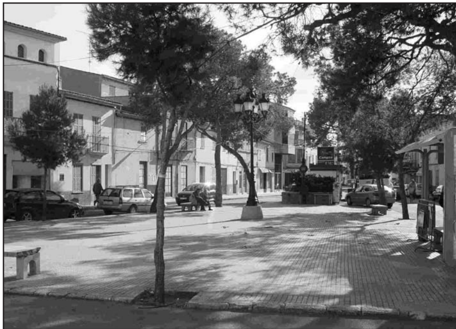
- L'Ajuntament durà endavant la reforma de la plaça de sa Creu.

Els pressuposts de l'Ajuntament de Campos per al 2004 varen ser aprovats en el darrer ple. Els comptes municipals pugen a 7,5 milions d'euros, dels quals més d'un milió es destinarà a inversions reals i directes del Consistori dins Campos. Dintre d'aquestes inversions s'ha de fer esment a la setena fase de les obres de les aigües i clavegueram de Campos, l'asfaltat de camins, la dotació de llibres, mobiliari i equipaments per a la biblioteca municipal. També dins el capítol d'inversions es preveu la creació d'una partida per a la compra de cadires, reforma a la plaça de sa Creu, restauració de l'aljub de cal Donat i reparacions al pavelló del camp municipal d'esports.