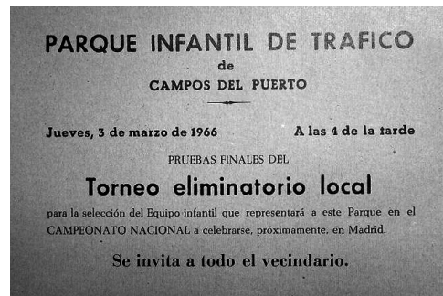
Fulletó de 1966 que publicitava l'acte a Campos i convidava al poble a assistir-hi (AJVC)