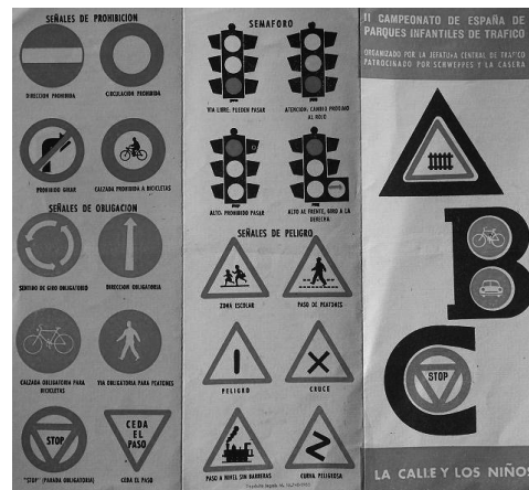
Tríptic editat per la Jefatura de Tráfico en motiu del II Campionat de Parcs Infantils (Col.lecció particular de l'autor)