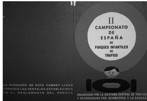
Carnet per participar al II Campionat de Parcs Infantils (AJVC)